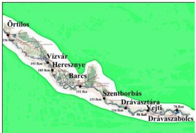
Areas relevant to water tourism on the Dráva

Tiedonpuute on suuri heikkous. On tuotettava esitteitä määritellyille kohderyhmille sekä parannettava suojeltuja lajeja kuvin ja tekstein kuvailevia opastuskylttejä alueen poluilla ja leirintäalueilla.