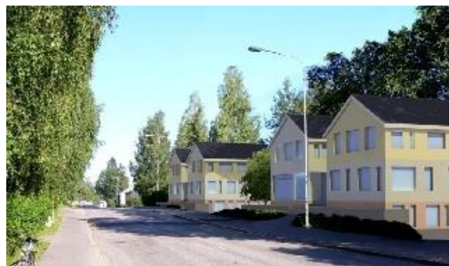
Kuvitteellinen näkymä samasta kohdasta vaiheessa, jossa asuinkerrostalot ovat korvanneet vanhat teollisuus- ja toimitilarakennukset. Katutasossa on toimisto- ja liiketiloja.