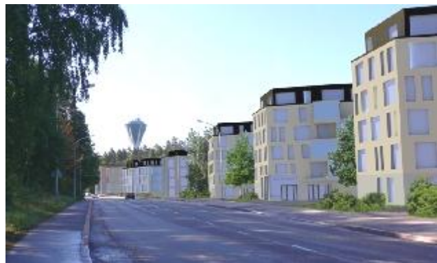
Kuvitteellinen näkymä samasta kohdasta vaiheessa, jossa asuinkerrostalot ovat korvanneet vanhat teollisuus- ja toimitilarakennukset. Katutasossa on toimisto- ja liiketiloja.