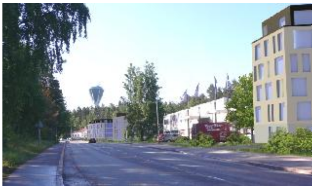
Kuvitteellinen näkymä Hirsimetsäntien alkupäästä itään vaiheesta, jossa osalle tonteista on rakennettu asuinkerrostaloja.