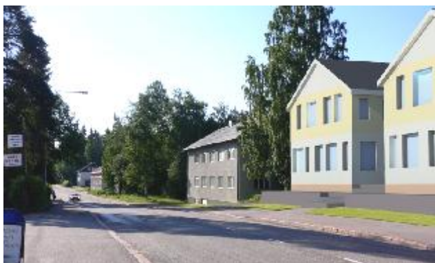
Kuvitteellinen näkymä Hirsimetsäntien keskivaiheilta länteen. Uusien ja vanhojen rakennusten erisuuntaisuus ei haittaa, kun mittakaava on yhtenäinen.