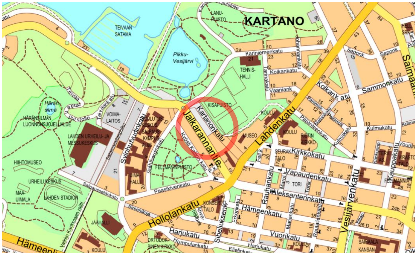
Kuva 1. Suunnittelualueen sijainti kartalla

Lähtötiedot esitetään tarkemmin asemakaavan selostuksessa.