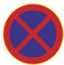
Pysäyttäminen kielletty (371)

Jakeluautonkuljettajan tulee liikkuessaan ja pysäköidessään ottaa huomioon myös muu liikenne ja hoitaa työnsä niin, ettei se vaaranna muita tiellä liikkuja.