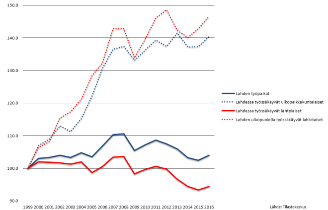
Kuva 2. Lahden työpaikat, alueella työssäkäyvät lahtelaiset ja ulkopaikkakuntalaiset sekä ulkopaikkakunnalla työssäkäyvät lahtelaiset.

Lahti työssäkäyntikaupunkina houkuttelee ulkopaikkakuntalaisia, mutta myös lahtelaiset pendelöivät aktiivisesti muihin kuntiin.