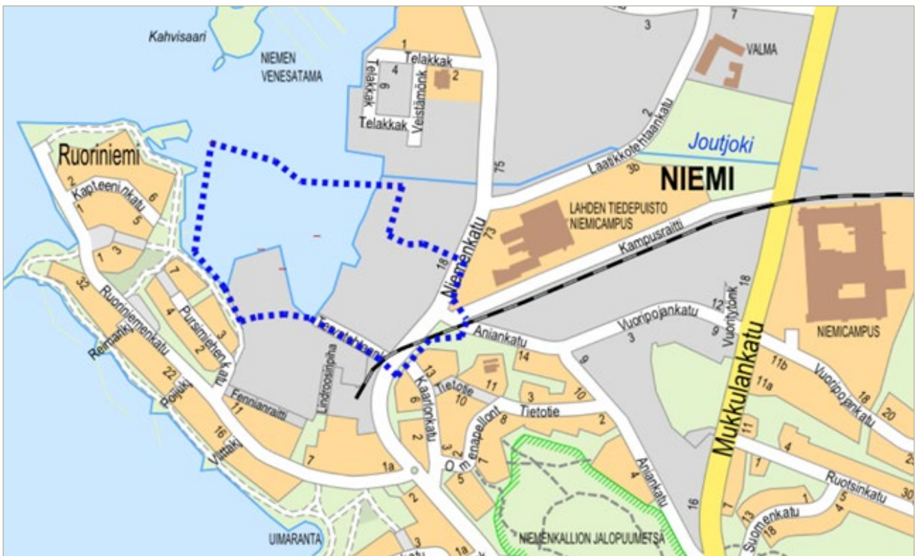
Kuva 1 Kaavakohteen sijainti opaskartalla.

Suunnittelualan pinta-ala on 11,5 ha, josta vesialueen osuus on noin 6 ha ja maa-alueen osuus on noin 5,5 ha.