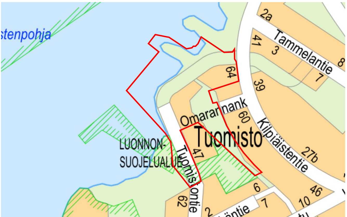
Kuva 1 Kaavakohteen sijainti opaskartalla.

Kaavamuutosalue sijaitsee Kilpiäisten kaupunginosassa Vesijärven rannalla.