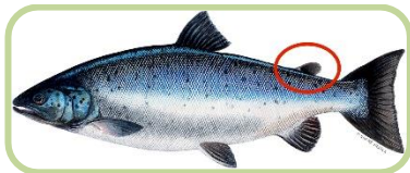
Järvilohi (aina leikattu rasvaevä)