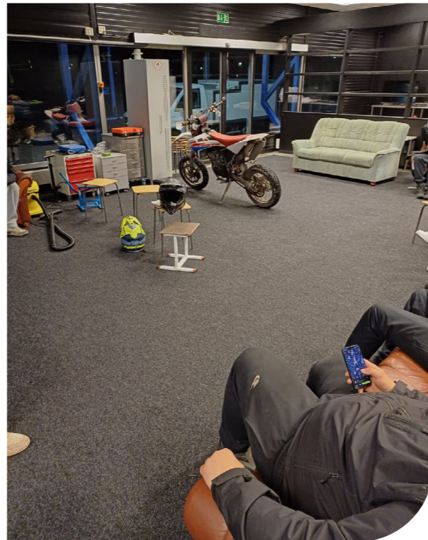
Nuoria ja työntekijöitä paikalla pikkujouluissa. Pikkujouluissakin tehtiin vielä korjaustöitä.

Alusta asti oli selvää, että pelkästään nuorisopalveluiden resurssein mahdollisuutta nuorten mopoilusta kiinnostuneiden kohtaamiseen sopivissa tiloissa, saati välineiden tarjoamiseen ja viikoittaisen aukiolon mahdollistamiseen, ei ollut. Yhteistyö Nastolan seurakunnan ja seurakuntayhtymän kanssa onkin ollut mopopajatoiminnan alkamisen ja jatkumisen kannalta avainasemassa. Työparityöskentely organisaatioiden välillä ja resurssien jakaminen on mopopajatoiminnan avain.