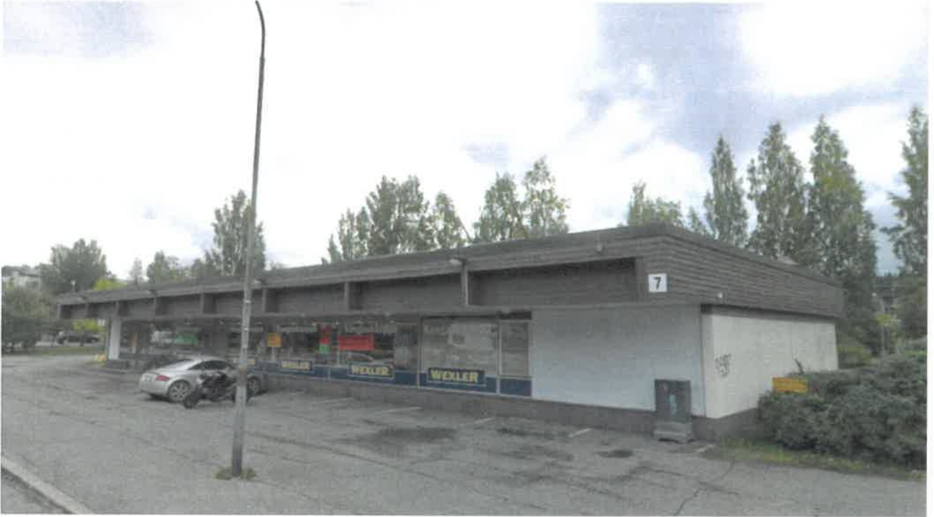
Ulkokuva: Sarvikatu 7 (2017).

Kiinteistön itäpuolella on tyhjiällä oleva seurakuntatalo. Muut aluetta ympäröivät kiinteistöt ovat asuinkäyttöön tarkoitettuja. Eteläpuolella noin 150 metrin päässä sijaitsee Jalkarannan peruskoulu. Lähimpiä palvelukohteita ovat noin 300 metrin päässä oleva päivittäistavarakauppa ja 150 metrin päässä oleva kirjasto.