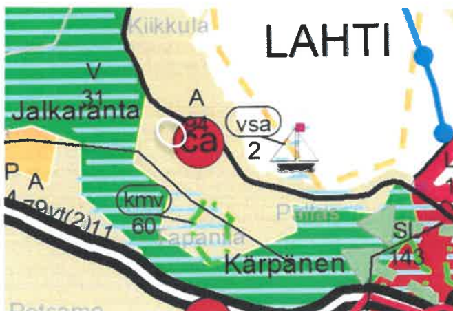
Ote Maakuntakaavasta 2014.

Aluetta koskevat seuraavat voimassa olevat kaavat ja suunnitelmat: