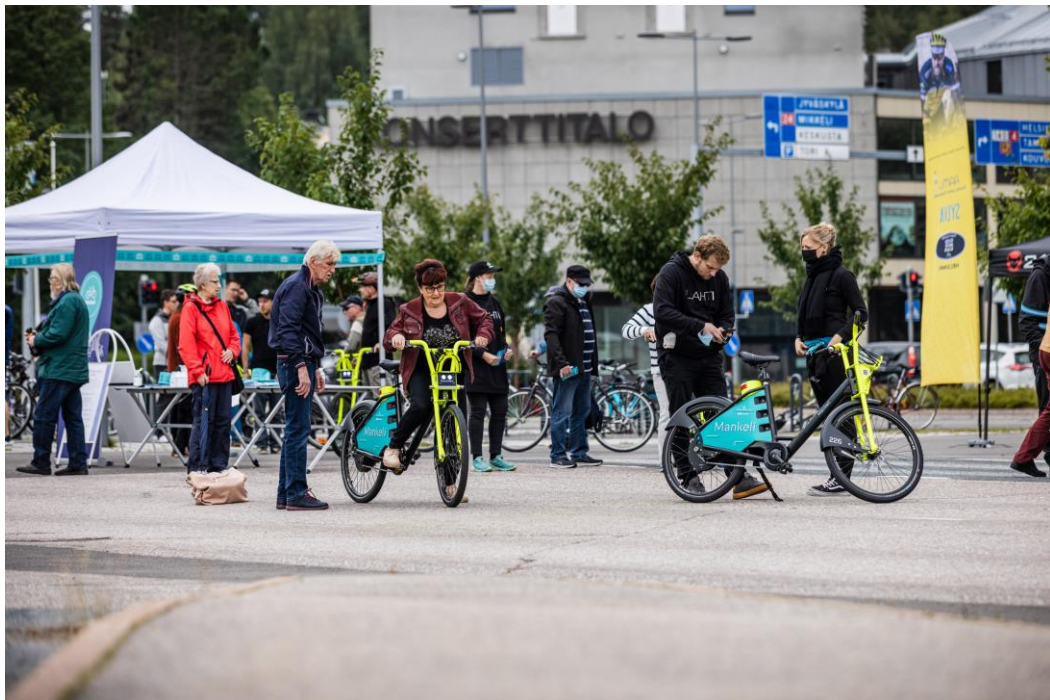
Kaupunkipyörät Mankelien koeajotapahtuma kiinnosti kaupunkilaisia. Kaupunkipyörien pilottikauden käyttäjäkyselyyn vastanneet (N=505) kaupunkilaiset pitivät palvelua erinomaisena.

Joukkoliikennettä täydentävä kaupunkipyöräjärjestelmä Mankeli otettiin käyttöön syyskuussa 2021. Kesällä 2023 kaupunkipyörien määrä tuplaantui: Mankeleita on käytössä 500 ja asemia 62.