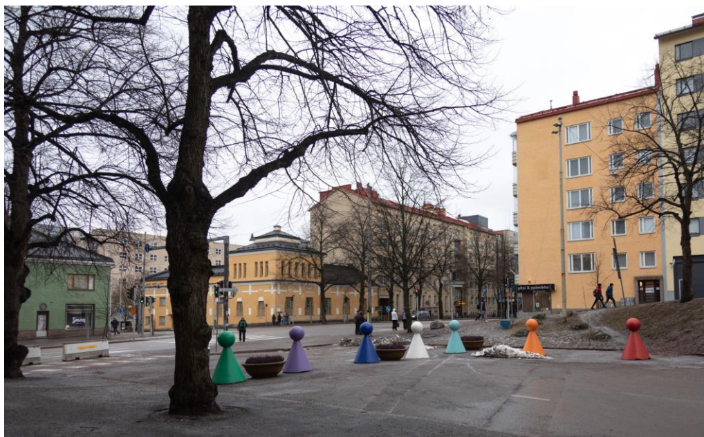
Viiskulman aukio maaliskuussa 2020.