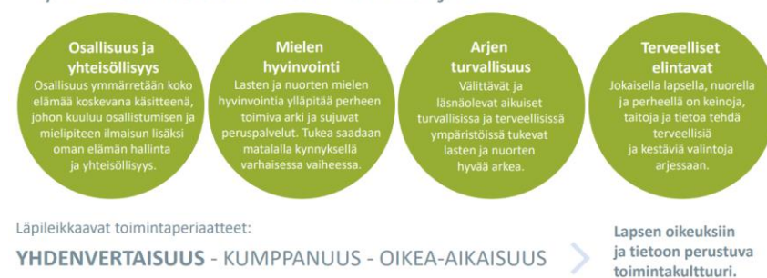
Kuva 2. Lasten ja nuorten hyvinvointisuunnitelmat painopistealueet Lahdessa 2022-2025