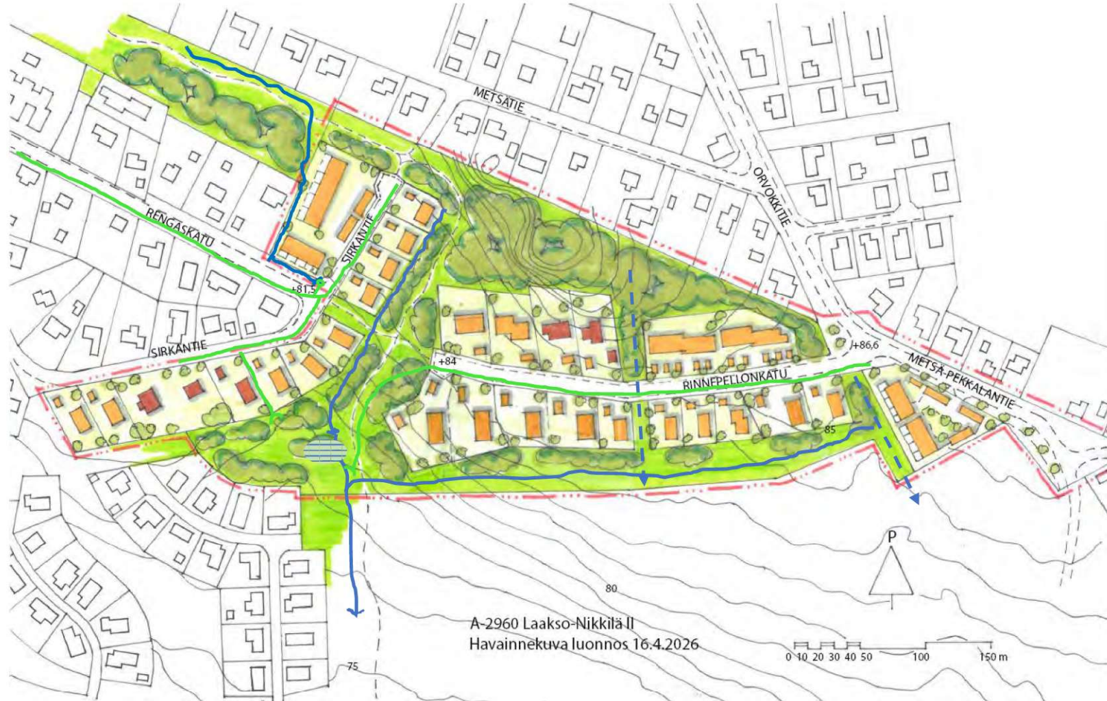
A-2960 Laakso-Nikkilä II Havainnekuva luonnos 16.4.2026