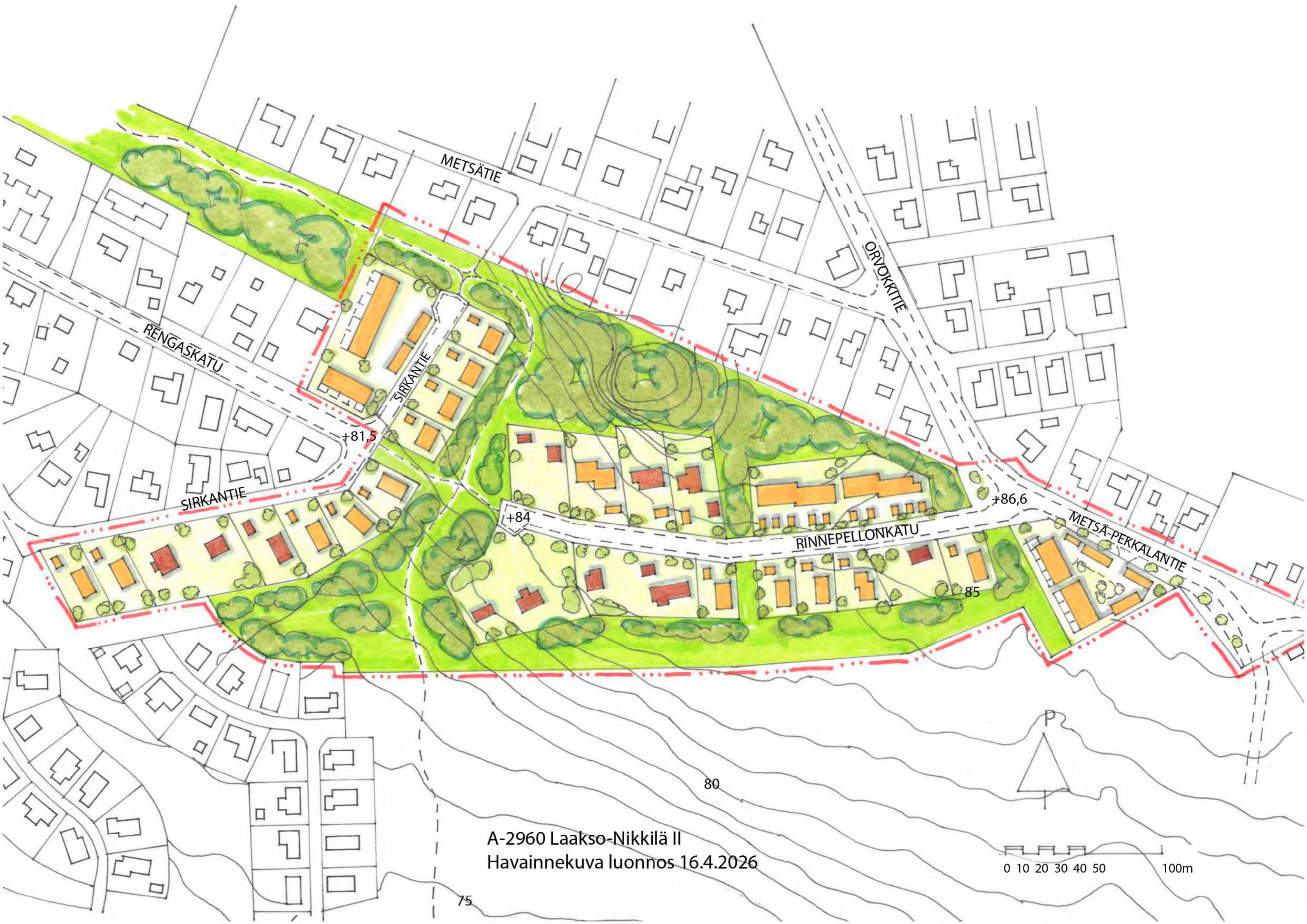
A-2960 Laakso-Nikkilä II Havainnekuva luonnos 16.4.2026