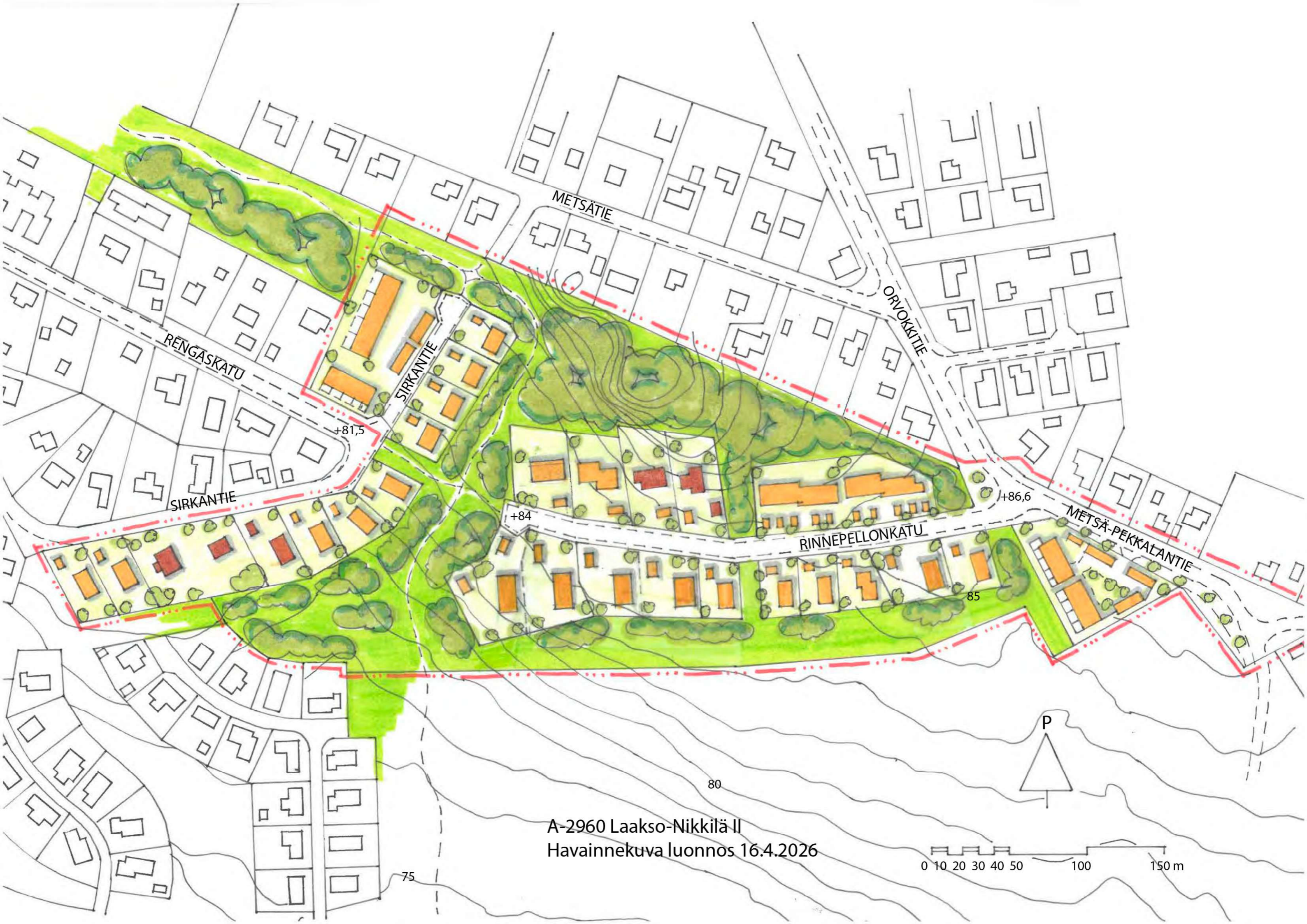
A-2960 Laakso-Nikkilä II Havainnekuva luonnos 16.4.2026